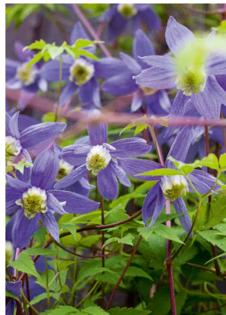
Die Blüten der Waldrebe ( Clematis alpina ) leuchten bei Einbruch der Nacht besonders blau.

Wenn die Laubbäume im Winter keine Blätter mehr haben, fällt die Rinde von Gehölzen besonders ins Auge. Gerade Birken mit ihrer hellen, weissen Rinde erhellen dann den kargen Garten.