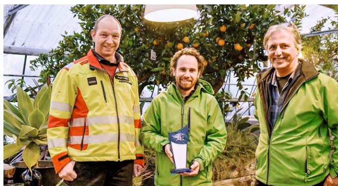
(Text und Foto: Benedikt Nüssli, Reussbote)

Feuerwehr-Einsatz, auch auf Maschinen und weiteres Material durfte die Feuerwehr Meltingen zurückgreifen.