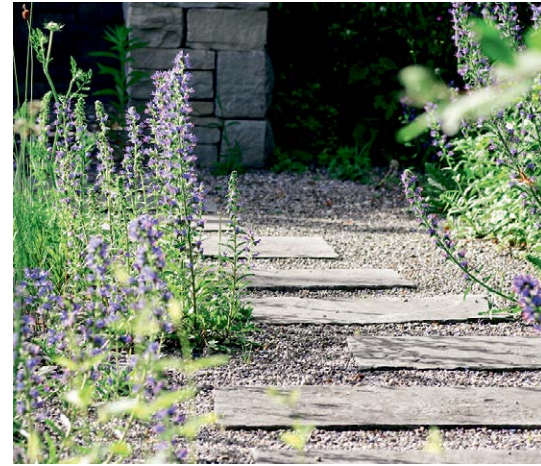
Mit Wildstauden lässt sich die ökologische Vielfalt eines Gartens vergrössern.

Um etwas Lebendigkeit in den eigenen Garten zu bringen, braucht es somit keine aufwendige Umgestaltung. Natürliche Elemente lassen sich einfach realisieren, passen in jeden Gartenstil und sind gut miteinander kombinierbar.