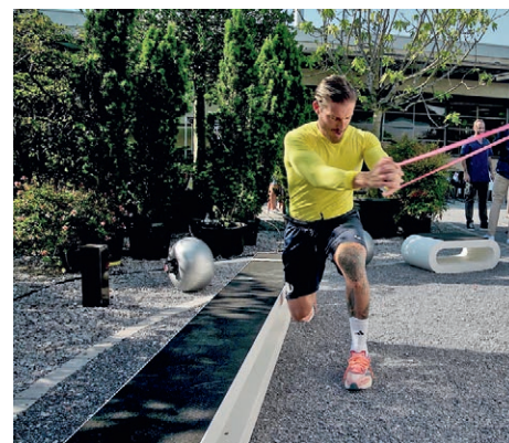
Outdoor-Fitnessgeräte vereinen körperliches Training und Naturerlebnis.

zeit, sondern um komplexe Geräte, die definierte Sicherheitsstandards erfüllen und witterungsbeständig sein müssen.